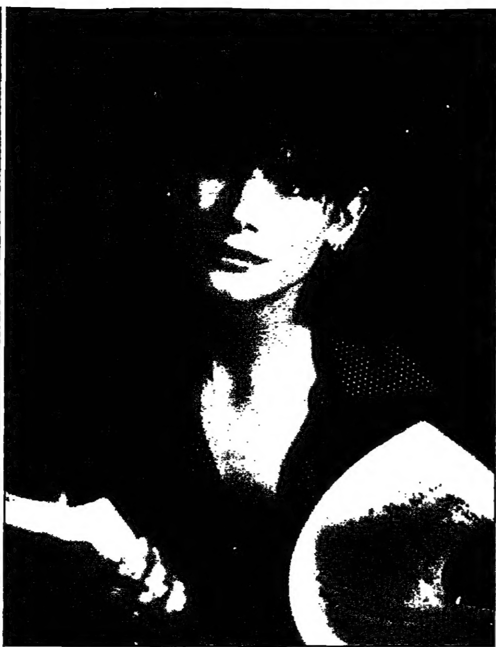
ساندرا بولوك النجمة الأمريكية الشابة لتتبع من تصوير الجزء الثاني من فيلم «السرعة» بعد نجاح الجزء الاول

صنعاء - افيدت وزارة الصحة اليمنية أمس الاثنين ان 21 طفلا تولى اثر حقنهم بطريق الخطأ بدمه الانسولين من قبل فريق طبي مكلف بتلقيح حملة تطعيم لطفال ضد الاورام لتلقيح. واوضح مصدر مسؤول في الوزارة ان الحادث وقع في منطقة مسور ريمة (100 كلم الى الشرق من صنعاء) وان الاطفال الذين تلقحوا اعطوا مادة الانسولين التي تستخدم لتخفيض معدل السكر في الدم بدلا من اللقاحات اللازمة للتطعيم للاطفال المصابة. كما اصيب عدد آخر بضعافات صحية. واوضح المصدر ان حملة التلقيح بدأت الاربعة الماضية وجرى خلالها حقن نحو مائة طفل بالانسولين بطريق الخطأ. وقد توفي 21 من هؤلاء الاطفال الخمسين قسر الالهائي الى احتجاز السكر الطبي الذي يقوم بحملة التلقيح والى فريق المسالك باليمن. واضاف ان السلطات الصحية تتكفل من ارسال فرق طبية الى المنطقة لدراسة للتجربة المبلغ وتحت من الفاشلة في الاطفال الاخرين. وتابع انه تم نقل المسالك الفطرية وعدها ست الى مستشفى الكويت في صنعاء ومن مخطط هذه الحالات تجاوزت مرحلة الخطر. واعرب المصدر باسم وزارة الصحة عن الالاف للحد من المسالك للولاء وقال ان السلطات تقوم حاليا بالتحقيق مع المتسببين به للكشف عن ملاماتهم وتحديد المسؤولين عنه. وتعتبر اليمن احد البلدان الاقل تقدما في العالم ويبلغ متوسط الدخل الفردي فيه 620 دولارا في السنة.